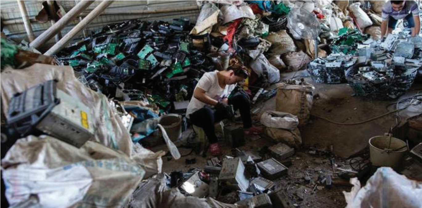
Xử lý rác thải điện tử không đúng cách sẽ gây nguy hại đối với sức khỏe con người và môi trường.