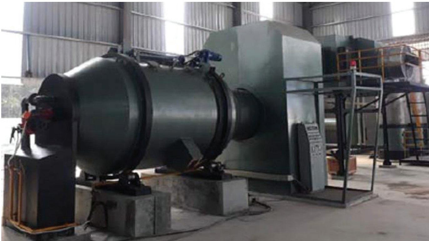
Lò đốt băng mạch và tái chế kim loại bằng hồ quang điện.

Ở Việt Nam, các nhà khoa học đã công bố nhiều nghiên cứu và triển khai dự án xử lý rác thải điện tử vào thực tế, từ đó đưa ra các giải pháp công nghệ phù hợp. Một số kết quả nghiên cứu đã được chuyển giao và áp dụng thành công vào thực tiễn, tạo ra giá trị cho các nhà đầu tư, doanh nghiệp, đồng thời đóng góp vào việc bảo vệ môi trường sinh thái. Một số giải pháp và công nghệ nổi bật, hiệu quả đã được các nhà khoa học Việt Nam phát triển.