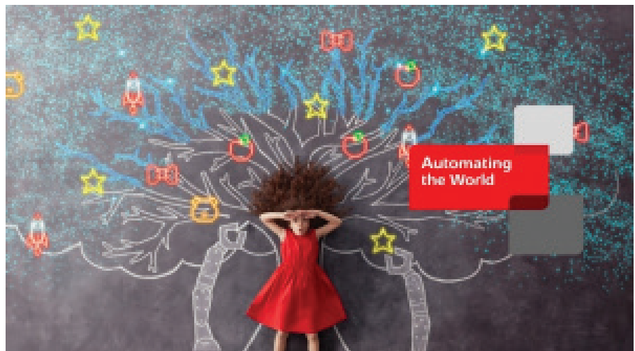
“Nâng cao tiềm năng sản xuất bằng công nghệ kỹ thuật số” giải thích về mối quan hệ giữa công nghệ kỹ thuật số và sản xuất.