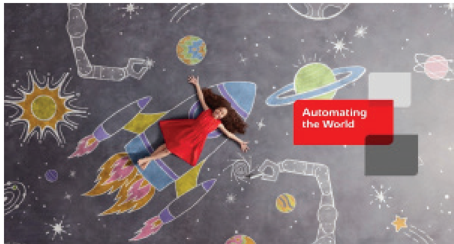
“Hãy sản xuất những thứ có ý nghĩa đối với bạn” là câu chuyện chủ đạo của chiến dịch.

Câu chuyện thứ 3 và cũng là câu chuyện cuối cùng có chủ đề “Sản xuất bền vững”, lý giải vì sao sản xuất bền vững góp phần tạo