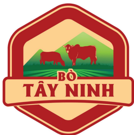
Nhãn hiệu chứng nhận “Bò Tây Ninh”.

Nhằm khắc phục những hạn chế, tạo mối liên kết bền vững giữa sản xuất, thị trường tiêu thụ và thiết lập chuỗi sản xuất hàng hóa khép kín; giúp nâng cao giá trị cho nghề chăn nuôi bò và ổn định thị trường tiêu thụ... việc phải xây dựng thương hiệu cho các sản phẩm, dịch vụ từ con bò được nuôi, thả trên địa bàn tỉnh Tây Ninh là cần thiết. Trước thực trạng đó, Trung tâm Nghiên cứu Công nghệ và SHTT CIPTEK đã đề xuất và được phê duyệt thực hiện nhiệm vụ “Xây dựng, quản lý và phát triển nhãn hiệu chứng nhận cho sản phẩm và dịch vụ từ con bò được nuôi, thả trên địa bàn tỉnh Tây Ninh”.