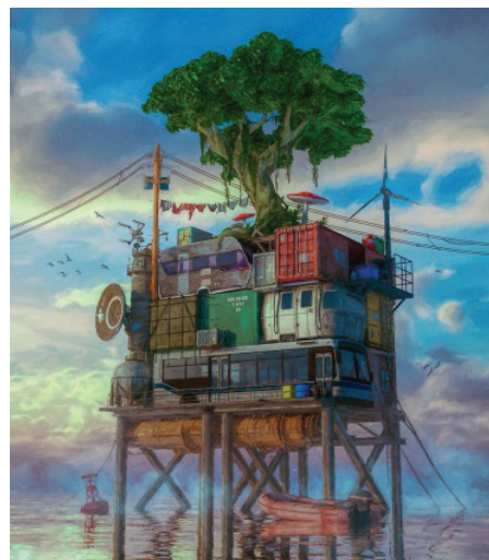
Những tác phẩm NFT có giá hàng triệu USD.

cấp sự bảo vệ cho các tác phẩm nhằm đảm bảo tác giả, nghệ sĩ và những nhà sáng tạo chân chính có thể khai thác giá trị kinh tế từ các sản phẩm sáng tạo của mình để bù đắp lại công lao sáng tạo và đầu tư, khuyến khích hơn nữa những sáng tạo trong xã hội, cũng như thúc đẩy sự phát triển văn hóa, nghệ thuật và khoa học. Phạm vi bảo vệ của bản quyền bao gồm tất cả các sản phẩm trong lĩnh vực văn học, khoa học và nghệ thuật mà không có bất kỳ giới hạn về hình thức thể hiện nào 6 . Tuy nhiên, sẽ có một số tiêu chuẩn cụ thể mà một sản phẩm phải đáp ứng để có thể trở thành tác phẩm được bảo vệ bản quyền (copyrightable work).