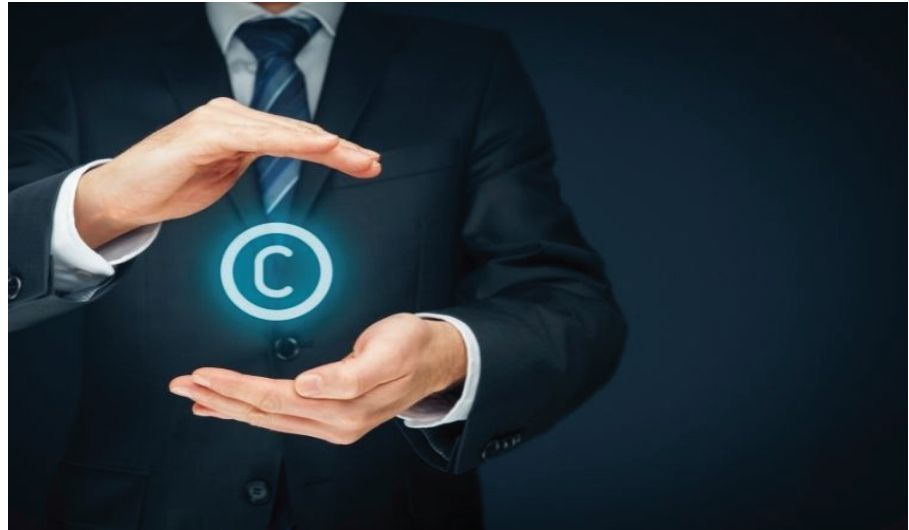
Bảo hộ quyền tác giả trong môi trường TMĐT là yêu cầu cấp thiết.

Thứ hai , cùng với tốc độ phát triển vượt bậc của mạng xã hội, các trang TMĐT ra đời và nhanh chóng nhận được sự đón nhận của đông đảo người tiêu dùng, đặt ra trách nhiệm của tổ chức, cá nhân trong việc cung cấp thông tin trên các trang TMĐT. Đây là vấn đề đã được pháp luật