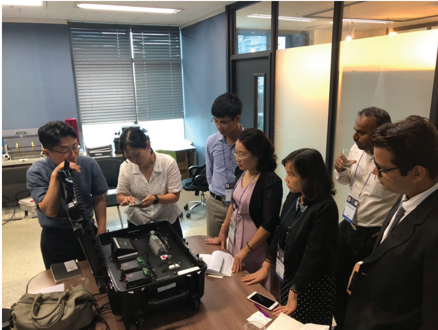
Các chuyên gia năng suất Hàn Quốc chia sẻ kinh nghiệm nâng cao NSLĐ trong doanh nghiệp với Viện Năng suất Việt Nam.

nhấn mạnh tầm quan trọng của đổi mới sáng tạo và KH&CN. Chiến lược nêu rõ “Hướng trọng tâm hoạt động khoa học, công nghệ vào phục vụ công nghiệp hoá, hiện đại hoá, phát triển theo chiều sâu góp phần tăng nhanh năng suất, chất lượng, hiệu quả và nâng cao sức cạnh tranh của nền kinh tế. Thực hiện đồng bộ các nhiệm vụ: nâng cao năng lực, đổi mới cơ chế quản lý, đẩy mạnh ứng dụng khoa học và công nghệ, tăng cường hội nhập quốc tế về khoa học, công nghệ” .