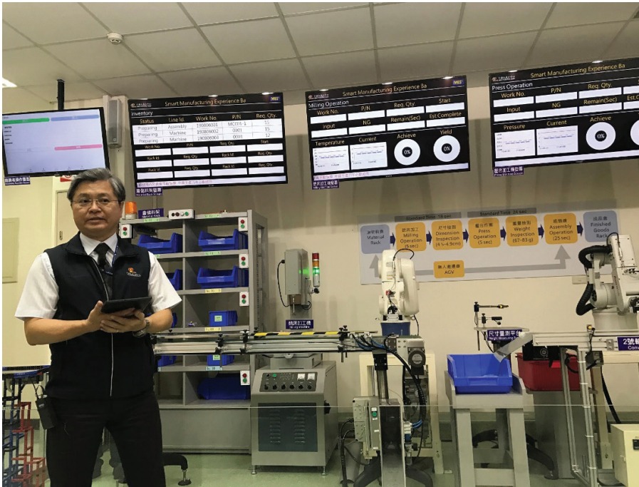
Chia sẻ mô hình đào tạo kết hợp với thực hành mô phỏng sản xuất và quản lý tự động tại Trung tâm Đào tạo (Đài Loan) cho các doanh nghiệp Việt Nam.

tâm sản xuất và dịch vụ thông minh, trung tâm khởi nghiệp đổi mới sáng tạo thuộc nhóm dẫn đầu khu vực châu Á; có NSLĐ cao, có đủ năng lực làm chủ và áp dụng công nghệ hiện đại trong tất cả các lĩnh vực kinh tế - xã hội, môi trường, quốc phòng, an ninh.