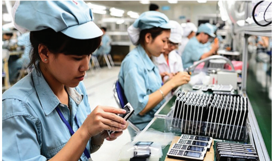
Việt Nam là một trong những nước có tốc độ tăng năng suất cao nhất ở châu Á.

Cơ cấu lao động của Việt Nam cũng có những thay đổi đáng kể. Tỷ lệ lao động trong lĩnh vực nông nghiệp giảm gần một nửa, từ 71% năm 1991 xuống 33% vào năm 2020, trong khi đó, lĩnh vực dịch vụ tăng từ 19 lên 36% và công nghiệp - xây dựng tăng từ 10 lên 31%.