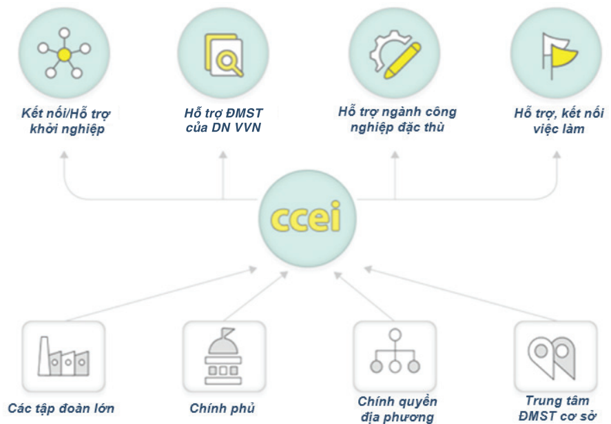
Hình 1. Vai trò của CCEI tại Hàn Quốc (nguồn: [2, 3]).

Kể từ năm 2015, Chính phủ Hàn Quốc [1] đã thiết lập 17 Trung tâm Kinh tế sáng tạo và đổi mới (Center for Creative Economy and Innovation - CCEI) với nhiều văn phòng đại diện ở các địa phương, nhằm hỗ trợ cho các doanh nghiệp khởi nghiệp ĐMST và doanh nghiệp vừa và nhỏ (DNVVN). Các trung tâm này giúp các doanh nghiệp khởi nghiệp ĐMST và DNVVN kết nối với các tập đoàn của Hàn Quốc cũng như các tập đoàn hoạt động trong khu vực (hình 1).